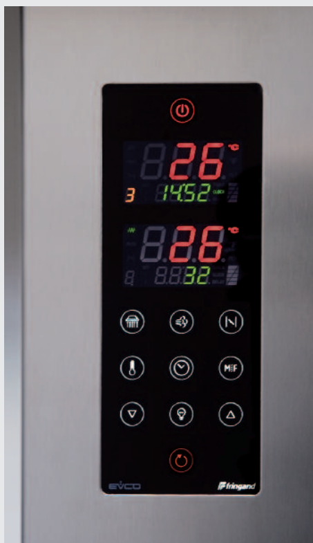
TABLEAU DE COMMANDE COMPRENANT UNE COMMANDE TACTILE MANUELLE

INDÉPENDANTE À CHAQUE ÉTAGE ET REGROUPANT POUR CHAQUE ÉTAGE LES FONCTIONS SUIVANTES :