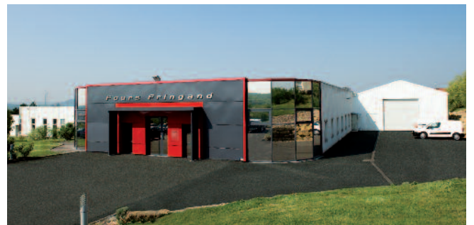
Usine de fabrication FRINGAND à ILLANGE

Constructeur 100 % français bénéficiant d'une situation privilégiée au cœur de la communauté européenne, Fringand poursuit depuis 1928 un objectif immuable : offrir aux clients les solutions les mieux adaptées à leurs besoins.