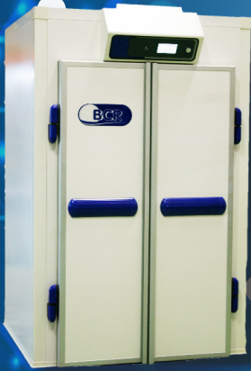
Chambre de fermentation